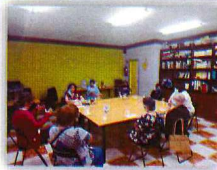
SERVICIO DE FAMILIAS

[Handwritten signatures and notes in blue ink]