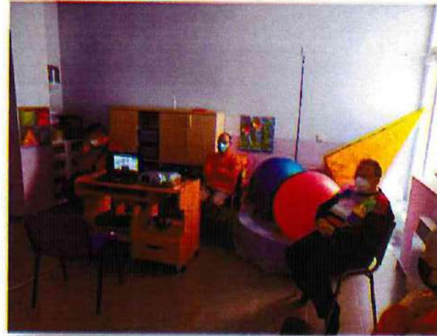
CENTRO DE DÍA